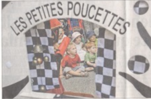
Les Petites poucettes servent encore au menu de ce vendredi

Bienvvenue aux ateliers Mais c'est dans les ateliers que se pressait la foule des enfants. Sur ce point, ce festival est unique en son genre. Imaginé pour les enfants, il se nourrit de cette passion et de l'envie formidable d'ouvrir à tous les bambins de nouveaux espaces d'expressions, de découvertes, de créations et de liberté. Les ateliers sont l'originalité d'Idéklic et la légitime fierté des organisateurs. Impossible ici d'en dresser une liste exhaustive. Disons qu'ils sont conçus pour une démarche intelligente dont l'enfant est l'acteur. Pour faire simple, on peut les classer en sept catégories : explorations et créations musicales (8 ateliers), découvertes et créations sur matières (13 ateliers), ateliers